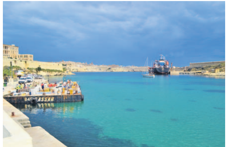
Een ponton vol vuurwerk in de haven van Kalkara.