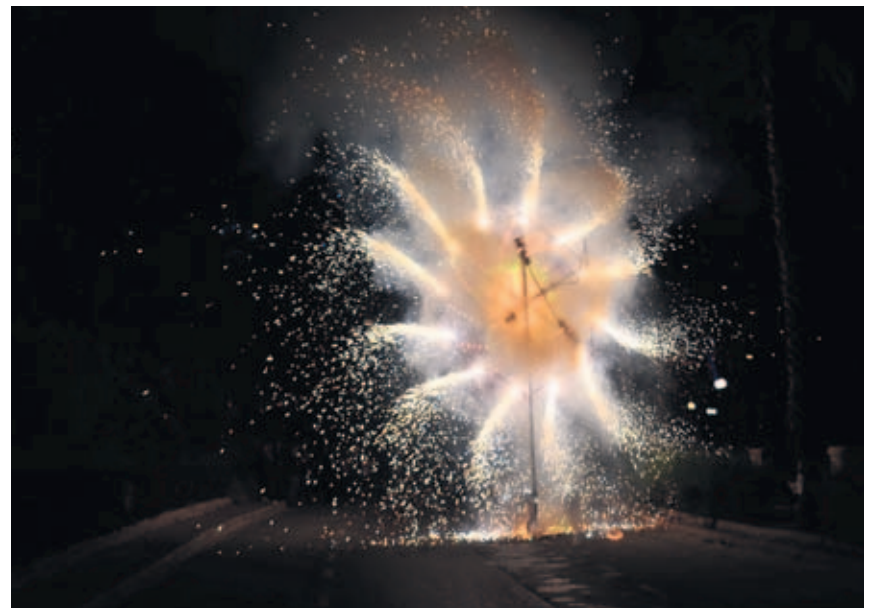
Een 'rad van Catharina' in volle actie.