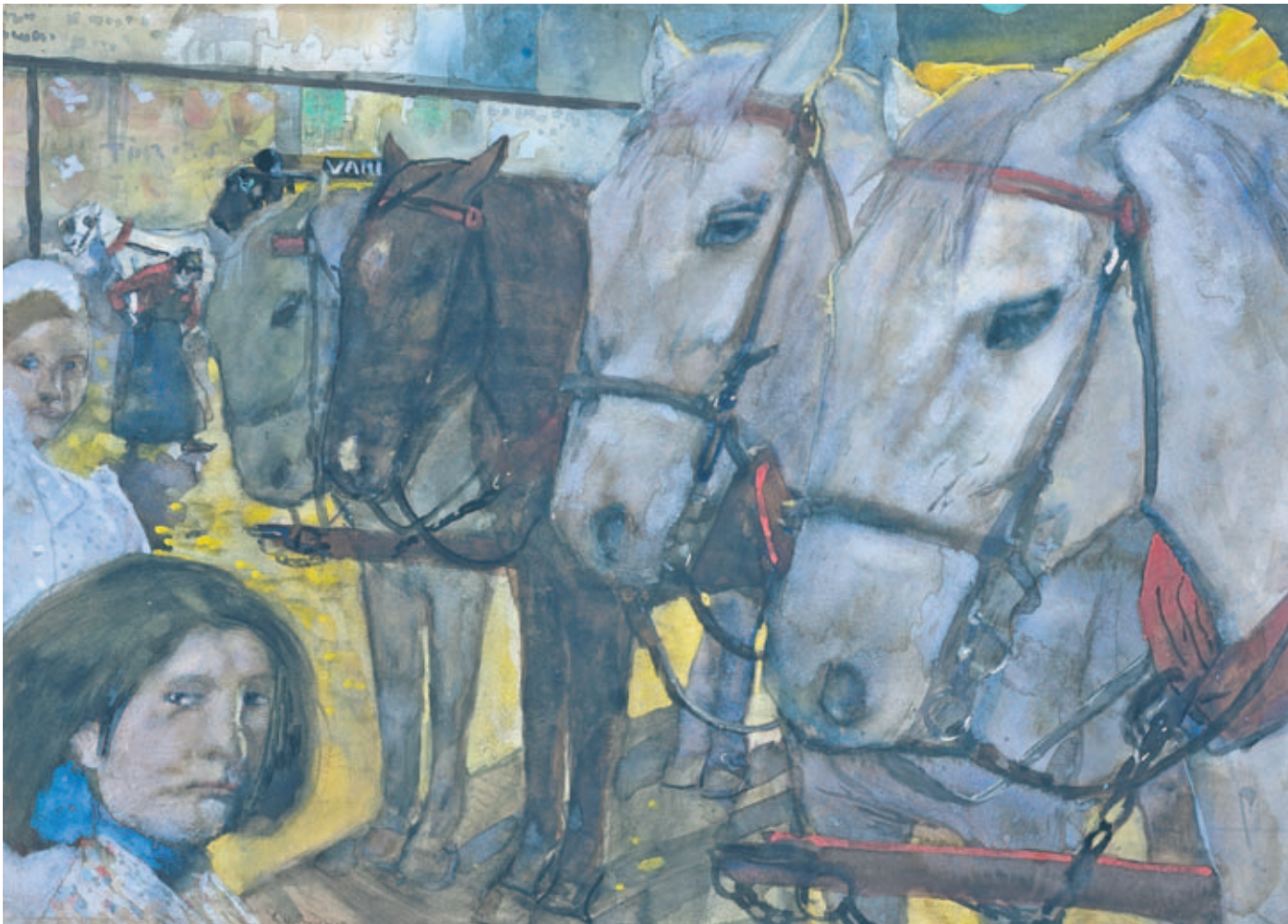
Trappaarden op de Dam, 1894. Aquarel, 54,5 x 75,5 cm (Rijksmuseum).