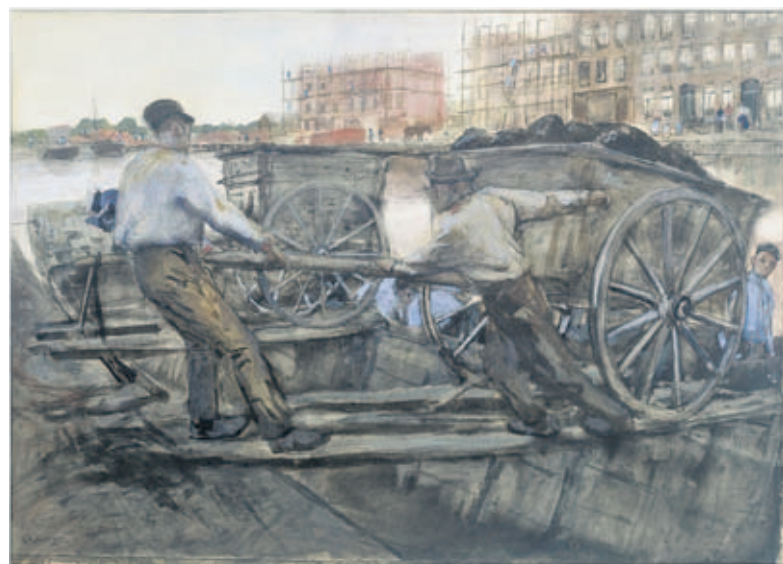
De grondkruisers, 1900. Geschilderd bij het Jacob van Lennepkanaal tijdens de stadsuitbreiding. Aquarel, 67,5 x 93,4 cm (Rijksmuseum).

Wie was toch die in zichzelf gekeerde man die eind negentiende, begin twintigste eeuw door Amsterdam slenterde met een schetsboekje, wat potloden en stukjes krijt of een camera onder de arm? Wie was die man die nooit iemand toeliet in zijn atelier maar met zijn schilderijen uitgroeide tot de belangrijkste impressionist van Nederland? De expositie in het Stadsarchief slaagt er wonderwel in heel dicht bij de maniertjes en de gewoontes van kunstenaar George Hendrik Breitner (1857-1923) te komen. De bij elkaar horende schetsen, foto's, en de uiteindelijke werken – meestal olieverf, soms aquarel – zijn in de tentoonstelling allemaal in één blik te vangen. Een mooie manier om toch stiekem bij de dwarsige kunstenaar over z'n schouders mee te kijken en samen met hem door het Amsterdam van rond 1900 te dwalen.