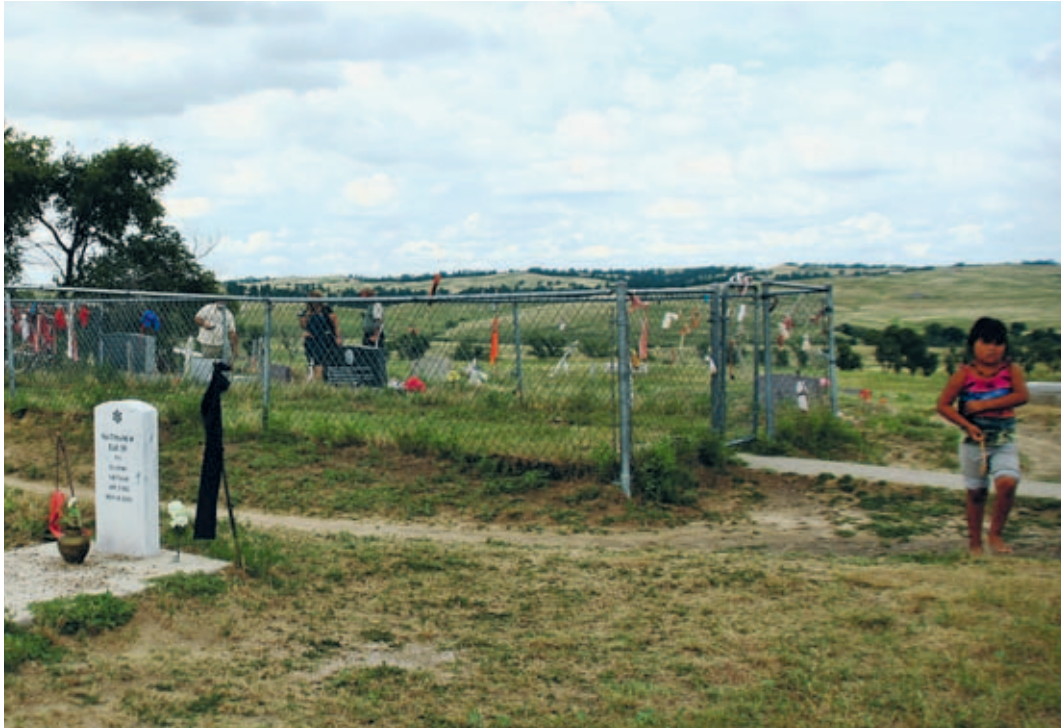
Het massagraf van de slachtoffers op 29 december 1890 is tegenwoordig een National Historic Landmark.

de indianen de blanken keer op keer weer het vertrouwen gaven. Hun vertrouwen in autoriteit was ongelooflijk sterk. Het leek wel of ze niet in staat waren te geloven dat iemand tegen hen kon liegen.'