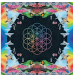
A Head Full of Dreams COLDPLAY PARLOPHONE / WARNER

De Britse band Coldplay staat tegenwoordig bekend als de grootste band ter wereld. Daarvoor hebben zanger Chris Martin en z'n bandmates een indrukwekkende route afgelegd die voert langs fraaie 'muzieklandschappen' als het onvolprezen album A Rush of Blood to the Head (met de klassieker 'Clocks') of het verrassende Viva la Vida met de innemende titelsong. De afgelopen jaren trad voor fans van het eerste uur vervreemding op, omdat Coldplay de wereld van de mainstream beats en ritmes betrad. Verandering van spijs doet eten, maar de weg van Coldplay naar 'het midden van de popmuziek' was bedenkelijk. Het leverde bombastische nummers als 'Paradise' en 'Every Teardrop Is A