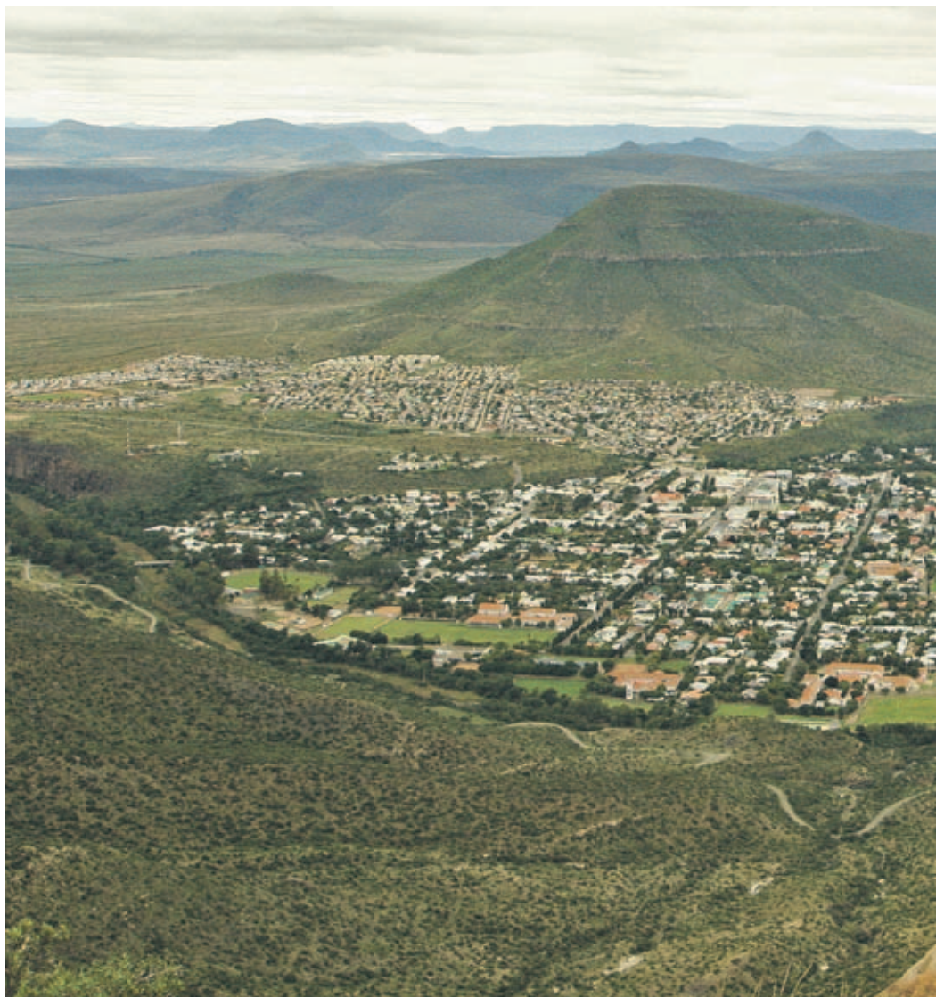
Uitzicht over Graaff-Reinet vanaf het plateau boven de Valle der Verlatenheid. links: De 'Groot Kerk' in Graaff-Reinet en de oude parochie, het 'Reinethuis', het mooiste Kaap-Hollandse gebouw in Graaff-Reinet. linksonder: Je mag geen stenen gooien in de Valle der Verlatenheid.