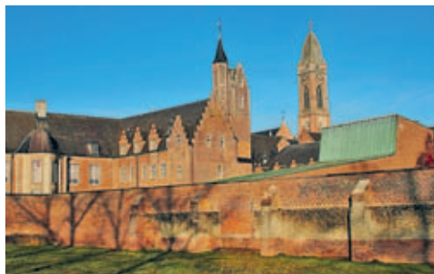
De Onze-Lieve-Vrouweabdij van Tongerlo. De replica van Leonardo da Vinci's Het Laatste Avondmaal hangt in het gebouwtje met het groene dak.

Het 'Leonardo-da-Vinci-museum' in de Onze-Lieve-Vrouweabdij van Tongerlo is geopend van 1 mei tot 30 september van 14.00 tot 17.00 uur. Meer info: tongerlo.org