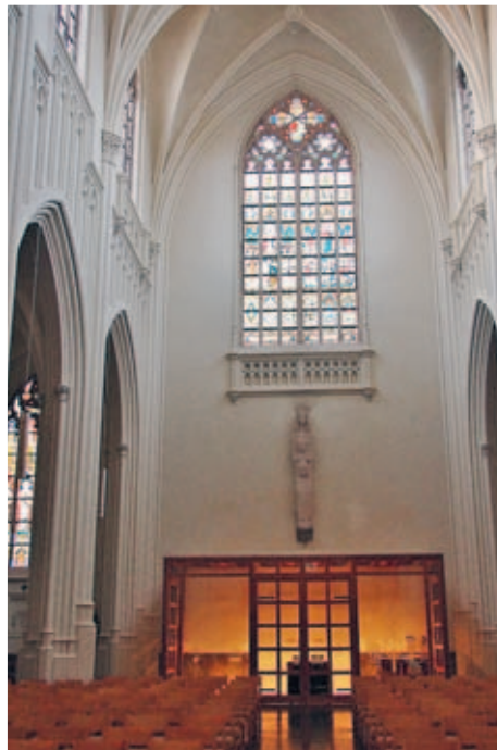
Misschien wordt Het Laatste Avondmaal weer teruggehangen op de plek waar het tot 1966 hing, boven de ingang van de abdijkerk.

In beide dwarsbeuken van de kerk hangen schilderijen met bijbelse tafereelen van de Vlaamse meester Jan-Erasmus Quellin (1634-1715); Jezus te gast bij Simon de Farizeeër en De Bruiloft te Kana. Bijzondere, maar ietwat donkere, sombere doeken en bij lange na niet zo bekend als het kolossale werk dat tot in de jaren zestig van de vorige eeuw de muur boven